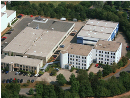
Firmenzentrale in Wiehl Company headquarters in Wiehl