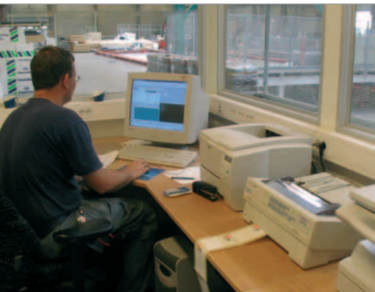
Leitstand mit UniCAM-Leitreechner bei Skandinaviska Byggelement in Schweden

Bringt eine Anlage trotz Leitreechner nicht die gewünschte Leistung, kann das verschiedene Ursachen haben. Einige dieser Ursachen lassen sich mit Hilfe des UniCAM-Leitrechners beseitigen oder zumindest reduzieren. Im Folgenden werden einige Quellen für Unproduktivität genannt und deren Behebung aufgezeigt.