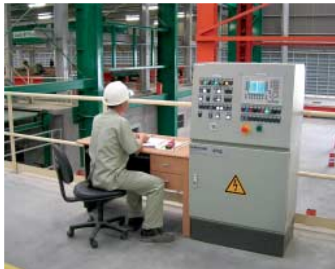
Fig. 2 A conventional control station.

Abb. 1 Touchscreen zur Bedienung des Palettenumlaufs.