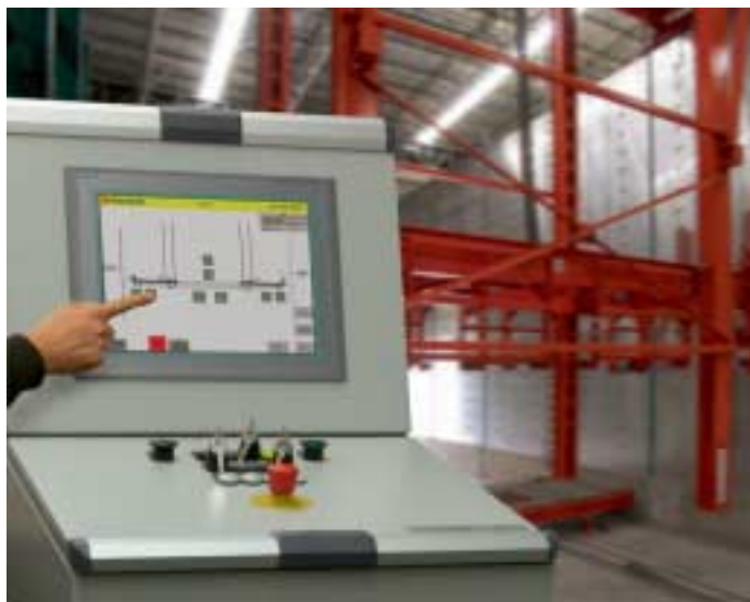
Fig. 1 Touchscreen for operating pallet rotation.

Abb. 1 Touchscreen zur Bedienung des Palettenumlaufs.