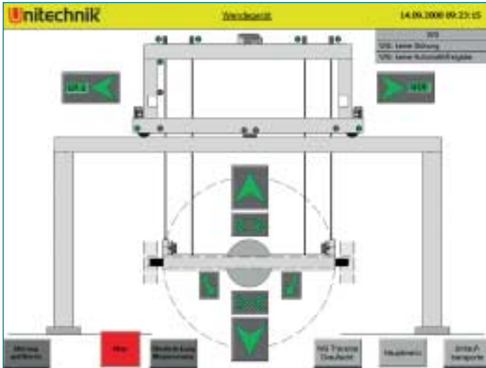
Fig. 3 Screen mask for a turning unit.