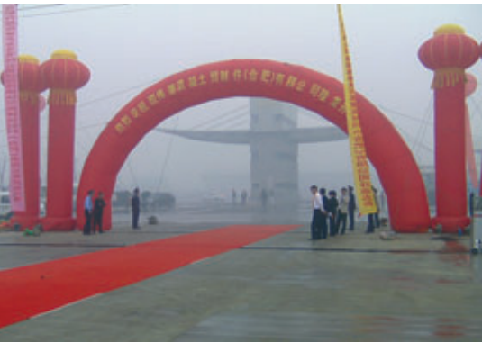
Feierliche Eröffnung des Betonfertigteilwerkes in Hefei

Die niedersächsische Sievert-Baustoffgruppe mit Sitz in Osnabrück ging im November 2006 zwei Joint-Venture-Verträge mit der in