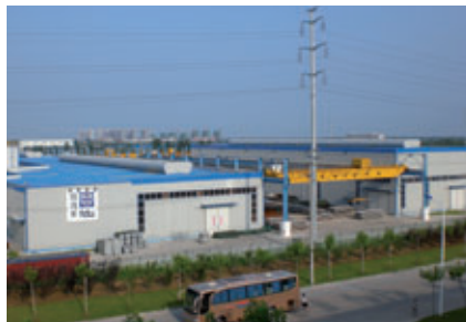
fdu-Betonfertigteilwerk in Hefei, China

schnell genug, um den Zuzug aus dem Umland zu bewältigen. Gebaut wird traditionell in Skelettbauweise. Die Fächer werden ausgemauert, die Decken eingeschalt und mit Ortbeton gegossen. Auf Maschineneinsatz wird weitgehend verzichtet. Die Arbeitskräfte sind billig und reichlich verfügbar. Der Nachteil an dieser Methode ist die Bauzeit. Derzeit dauert es ca. 18 Monate bis ein neuer Wohnkomplex fertiggestellt ist. Genau hier setzt Sievert mit seinem Betonfertigteilwerk an. Mit Betonfertigteilen ließe sich die Bauzeit auf 12 Monate reduzieren. Und das bei deutlich verbesserter Qualität.