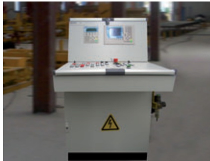
Neue Steuerstelle für den Plotter mit modernen Siemens Komponenten