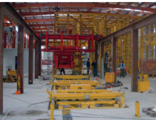
Frisch angestrichen, werden die Anlagenteile aus Coswig wieder aufgebaut

Hefei ansässigen Haiheng-Gruppe ein. Es entstanden die Firmen Sievert quick-Mix Building Materials Co. Ltd. und Sievert Concrete Precast Elements Co. Ltd.. An beiden Firmen hält Sievert 66,7 % der Anteile. Der Joint-Venture-Partner Haiheng-Group ist eine bedeutende Projektentwicklungsgesellschaft, die Wohnungen und Gewerbeimmobilien betreut.