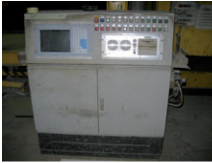
Alte Steuerstelle für den Plotter