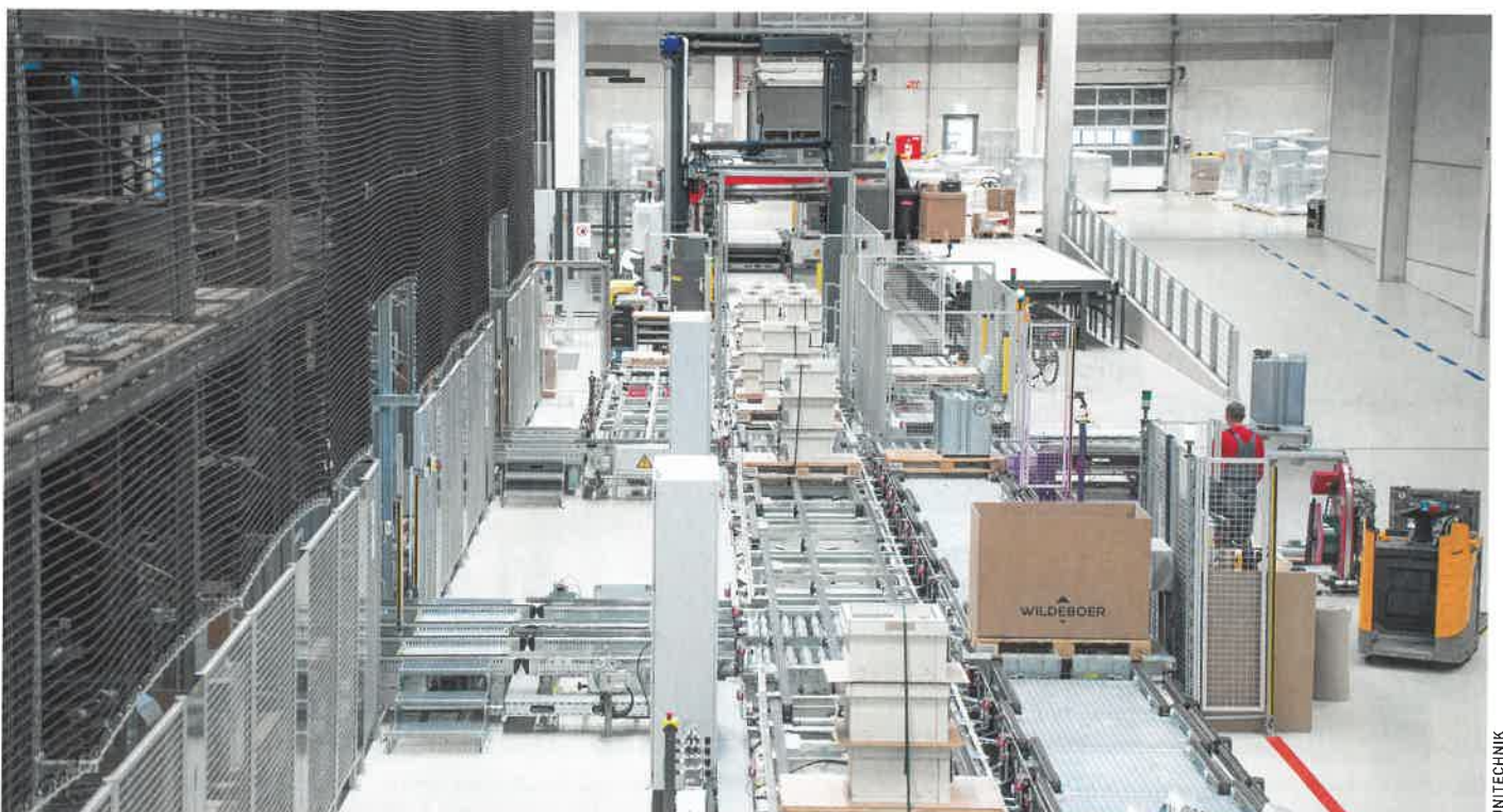
Aus einem hochdynamischen Versandpuffer fahren die Paletten in die Konsolidierungszone.

Eine große Bedeutung spielt bei Wildeboer die Konsolidierung von Aufträgen. Ziel ist es, das Versandvolumen zu minimieren. Dazu werden die für Kundenaufträge bestimmten Paletten zunächst automatisch in einem hochdynamischen Versandpuffer zwischengelagert. Die von der Wildeboer-eigenen Konsolidierungssoftware abgerufenen Paletten fahren automatisch in die Konsolidierungszone. Nach dem Prinzip „Pack-by-Light“ sieht der Mitarbeiter über farbige Leuchtanzeigen auf den ersten Blick, welche Paletten zum selben Auftrag gehören, und ordnet die Artikel so an, dass möglichst wenige Paletten benötigt werden. Diese Nachverdichtung spart Frachtkosten und schont die Umwelt. Da die Produkte meist auf Baustellen geliefert werden, werden die Paletten vor der Verladung mittels eines automatischen Wicklers regenfest verpackt.