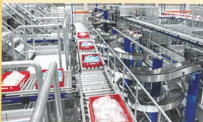
Unitechnik Systems realisierte eine Hochleistungsanlage für Borgmeier Frischgeflügel.