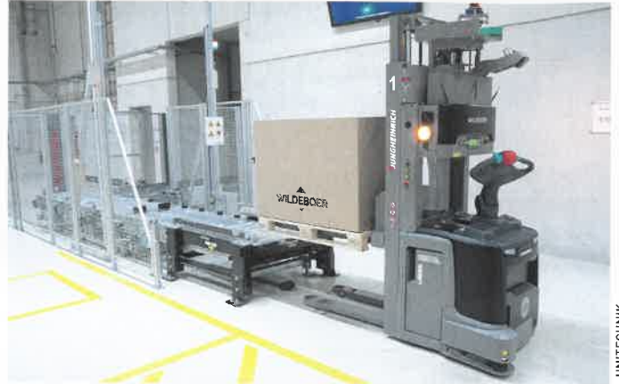
Die gefertigten Bauteile werden über FTS aus der Produktion abgeholt, an die Unitechnik-Fördertechnik abgegeben und eingelagert.

Das von Unitechnik realisierte Logistikzentrum ist das zentrale Materialflussschneidkreuz von Wildeboer. Im Zentrum stehen ein dreigassiges Hochregallager für Europaletten und Gitterboxen mit 9.230 Stellplätzen sowie ein eingassiges automatisches Kleinteilelager für KLT-Behälter. Gelagert werden hier Rohstoffe, Halbzeuge und Fertigprodukte. An kombinierten Paletten- und Behälterkommissionierplätzen wird Material sowohl für die Produktion wie auch für Kundenaufträge zusammengestellt. Das Rohmaterial für die Produktion wird an verschiedene Fahrerlose Transportsysteme übergeben. Alle gefertigten Bauteile werden wiederum über diese FTS-Fahrzeuge aus der Produktion abgeholt, an die Unitechnik-Förder-